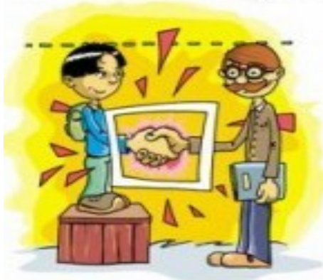
rysunek: Hubert Roniek

Zbiór zasad savoir-vivre obowiązujących w Internecie.